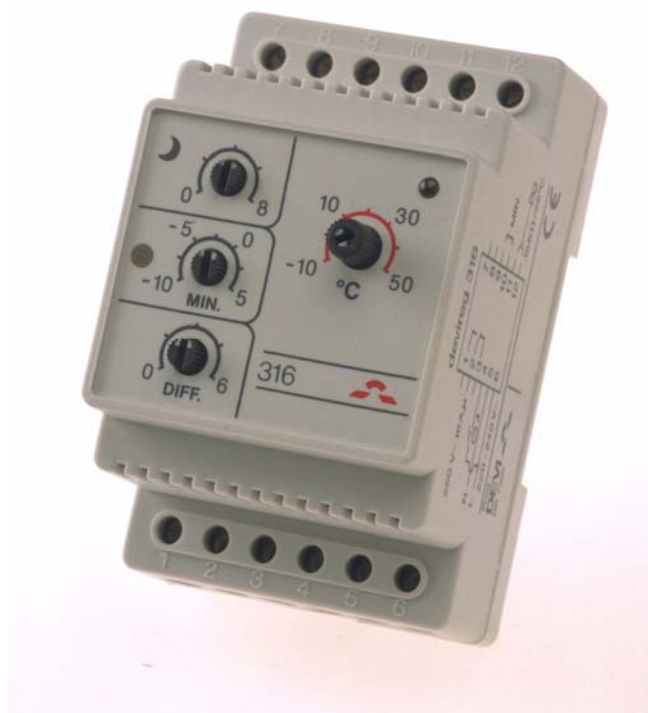
Рис. 1. Электронный терморегулятор Devireg™ 316 .

Универсальный электронный терморегулятор Devireg™ 316 (рис. 1) применяется для управления электрическими кабельными системами обогрева (КСО) различного назначения (табл. 1). Может также быть использован для управления другими системами электроотопления или системами отопления с электрическими блоками контроля.